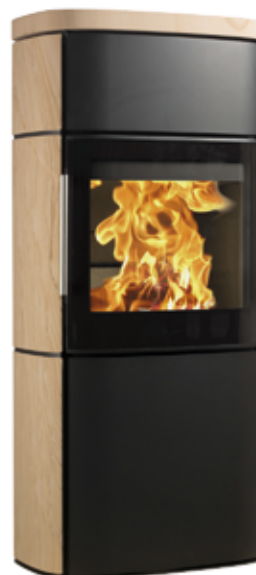
HWAM 4660m Tobacco