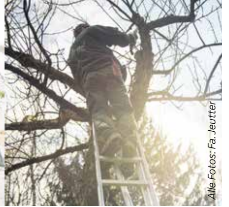
Gartenpflege von den Profis.