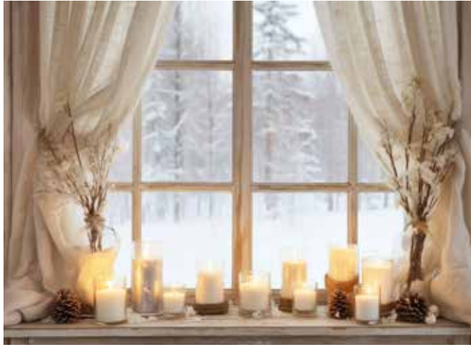
Die kalte Jahreszeit weckt das Bedürfnis nach Wärme und Gemütlichkeit zu Hause.

Der Winter bringt nicht nur frostige Temperaturen, sondern auch das Bedürfnis nach Wärme und Gemütlichkeit in den eigenen vier Wänden. Gerade in der kalten Jahreszeit ist die Wahl der richtigen Bettdecke entscheidend, um erholsam schlafen zu können.