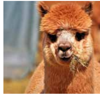
Alpaka-Wolle: kuschelig, wohligh warm und natürlich gut.

Die Fasern der Alpakawolle können bis zu 30 Prozent ihres Eigengewichts an Feuchtigkeit aufnehmen, ohne sich feucht anzu-