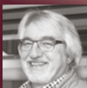
ROLLADENBAU DÄHS GMBH Die GAYKO Mehr-Wert-Aktion Jetzt bei Dähs.