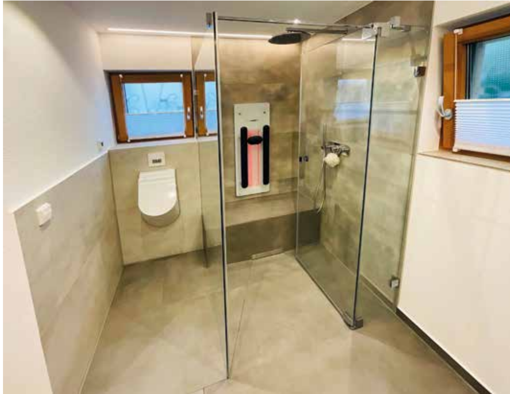
Wellness im Kleinen: Dampfbad mit Infrarotelement als Highlight im Badezimmer.

Mit Saunen, Dampfduschen oder Infrarot-Paneelen von Häfele Bad & Wärme kann auch das kleinste Badezimmer zur Wellnessoase werden.