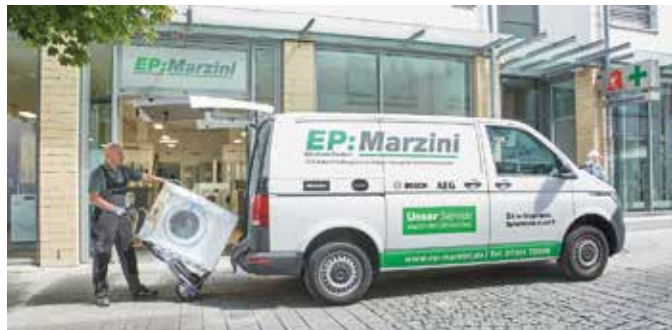
Service pur: Das Team von EP:Marzini liefert die Geräte aus, schließt sie an und konfiguriert sie bei Bedarf.