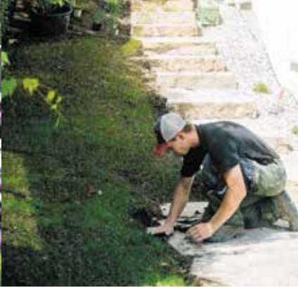
Auch Teilgestaltung des Gartens möglich.