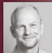
JEUTTER GÄRTEN UND PFLANZEN Gartenplanung und Pflege von den Profis.