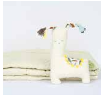
Die Alpaka-Bettdecke „Alpnest“ der Firma Wailand.

Für Menschen mit Allergien oder sensibler Haut sind Alpaka-Bettdecken die perfekte Wahl. Alpakawolle enthält im Gegensatz zu Schafwolle kein Lanolin, das oft Hautreizungen oder allergische Reaktionen hervorrufen kann. Die hypoallergene Beschaffenheit der Alpakafasern macht die Bettdecken von WAILAND daher besonders hautfreundlich und für Allergiker geeignet.