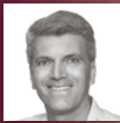
EP: MARZINI ELECTRONIC PARTNER Showroom mit den aktuellsten Geräten.

Garantie Vor, während und nach unserer Leistung