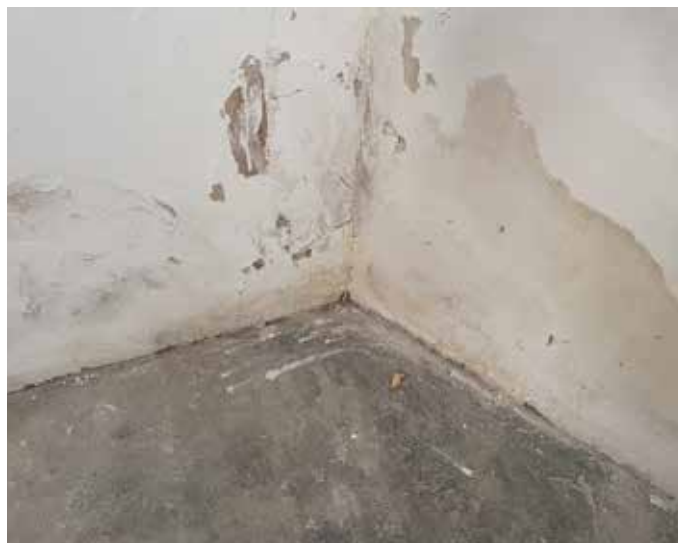
Feuchtigkeit durch Hochwasser oder anderen Ursachen ist für Räume eine Gefahr.