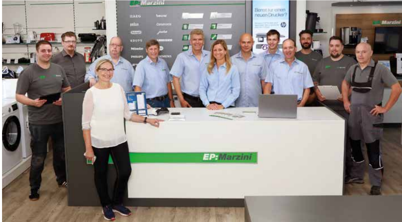
Das gesamte Team von EP:Marzini freut sich auf Ihren Besuch!

Noch bis zum 9. November gibt's bei EP:Marzini attraktive Hausmesse-Angebote und eine Alt-gegen-Neu-Aktion in beiden Fachgeschäften in der Göppinger Innenstadt.