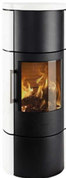
HWAM 3660c Moca Cream