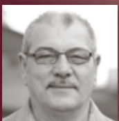
WAILAND BETTWARENFABRIKATION Alpaka-Bettdecken von WAILAND: Ihre beste Wahl für den Winter.