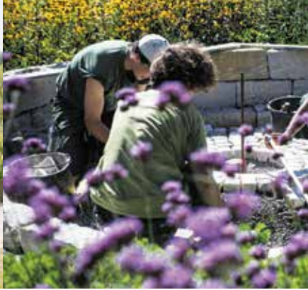
Gartenbau von den Profis.