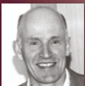
STUCKATEUR HOFELE Gebäudeabdichtung für innen und außen in Kombination mit einer Kellerlüftung.