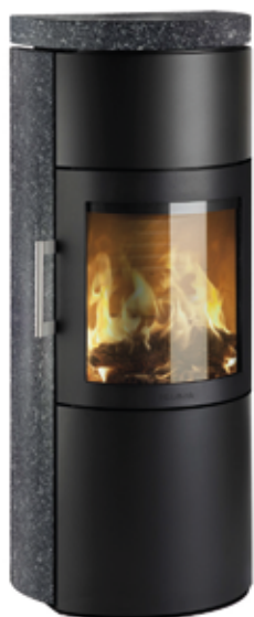
HWAM 3520c Dark Galaxy