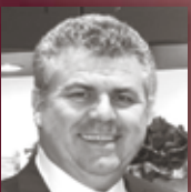
KITCHEN COMPANY Coole Auswahl – auch bei Kühlschränken.