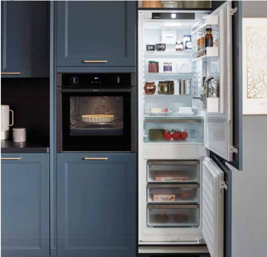
Auch die Kombination aus Kühlschrank mit Gefrierfach und 0-Grad-Zone ist möglich.