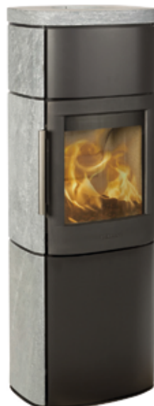
HWAM 4560c Speckstein