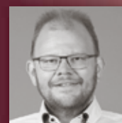
HÄFELE BAD & WÄRME Herbstzeit ist Wellnesszeit.