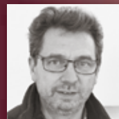
FEUERGALERIE LEINWEBER Genießen Sie die Wärme noch länger...