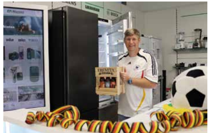
Beim Kauf eines Großgeräts gibts einen Kasten Craft-Beer dazu.

schäfte auch auf deutsche Hersteller, deren Geräte man reparieren kann – das sei nachhaltig und im Sinne der Kunden. „Wir haben eine eigene Werkstatt, in der wir sowohl Geräte für Unterhaltungselektronik als auch Großgeräte reparieren können“, sagt Marzini. Dabei sei es auch egal, wo das Gerät gekauft wur-