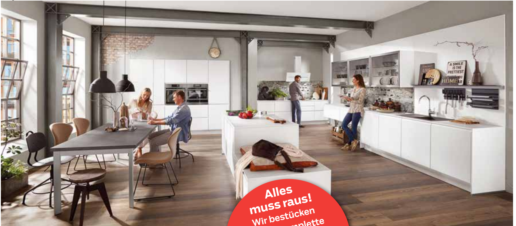
Planungsbeispiel einer Wohnküche mit integriertem Essbereich.