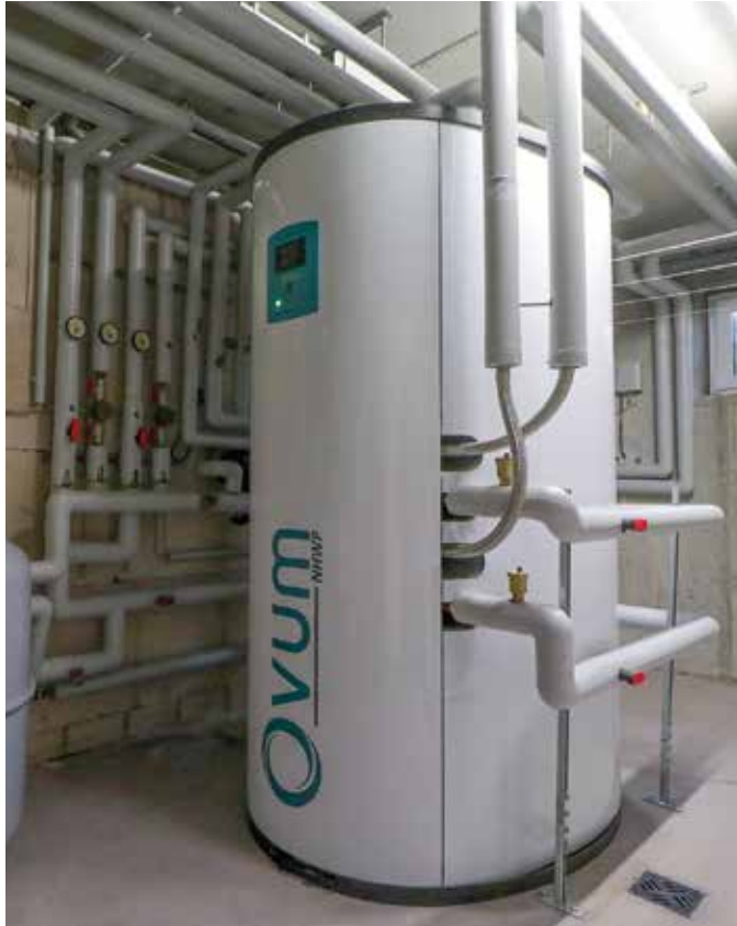
Die leistungsstarke und moderne Wärmepumpe zeichnet sich durch eine besonders hohe Jahresarbeitszahl aus.

Nachhaltig und günstig heizen mit einer Wärmepumpe: Häfele Bad & Wärme bietet dafür effiziente Lösungen.