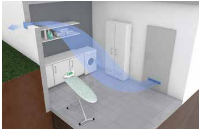
Die eigenständigen Lüftungssysteme eignen sich perfekt für eine unabhängige Entfeuchtung von Keller- und Hauswirtschaftsräumen.

tor, der dank moderner und hochwertiger Steuerungselektronik den bedarfsgerechten Betrieb nur dann aufnimmt, wenn die absolute Feuchte im Kellerraum höher ist als im Freien. Durch den integrierten Innenfühler am Abluftventilator gelangt weder feuchte noch warme Luft in den Keller, welche dort kondensieren kann. Die automatische Lüftung läuft nur, wenn mit der Außenluft auch getrocknet werden kann. „Das System des namhaften Herstellers ‚Maico‘, das wir dafür nutzen, bietet für jeden Einbaufall die passende Lüftungsstrategie, weil sich die Anlage mit nur einer Kernlochbohrung sehr einfach installieren lässt und aufgrund des permanenten Luftvergleichs zu jeder Zeit die optimale Regelung gewährleistet“, fasst Jürgen Hofele zusammen. Sowohl bei Neubauten als auch bei Sanierungen ist es in allen Kellerräumen die ideale Lösung für den langfristigen