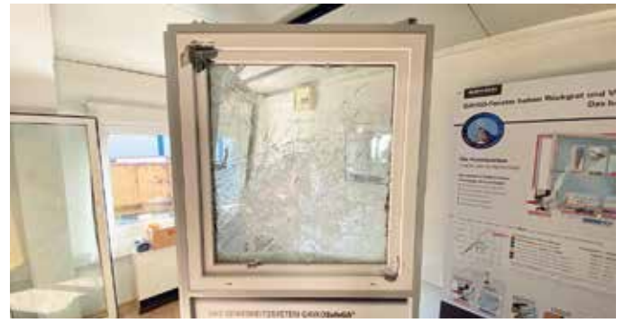
Das Fenster hielt dagegen und gewann!