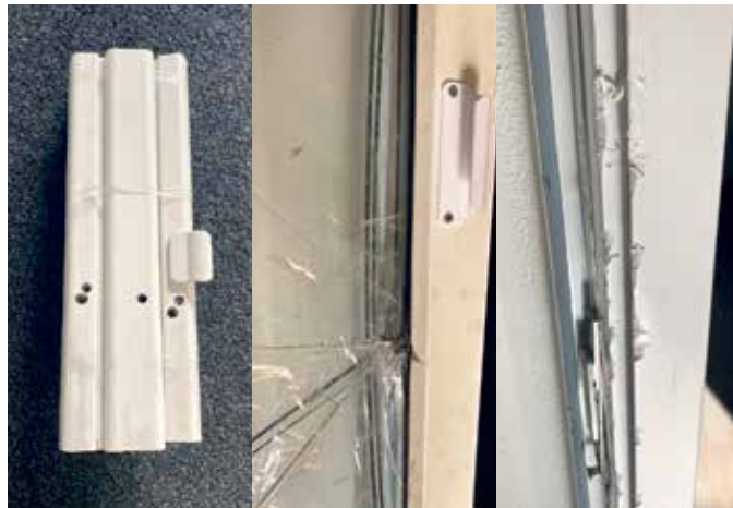
Ein echter Einbruch!

Wären diese Einbrüche bei einem SafeGa 5000 von Gayko erfolgreich gewesen? NEIN! An diesem Gayko SafeGa 5000 SL haben wir es versucht. Mit schwerem Werkzeug. Sogar in gekipptem Zustand. Dabei wen-