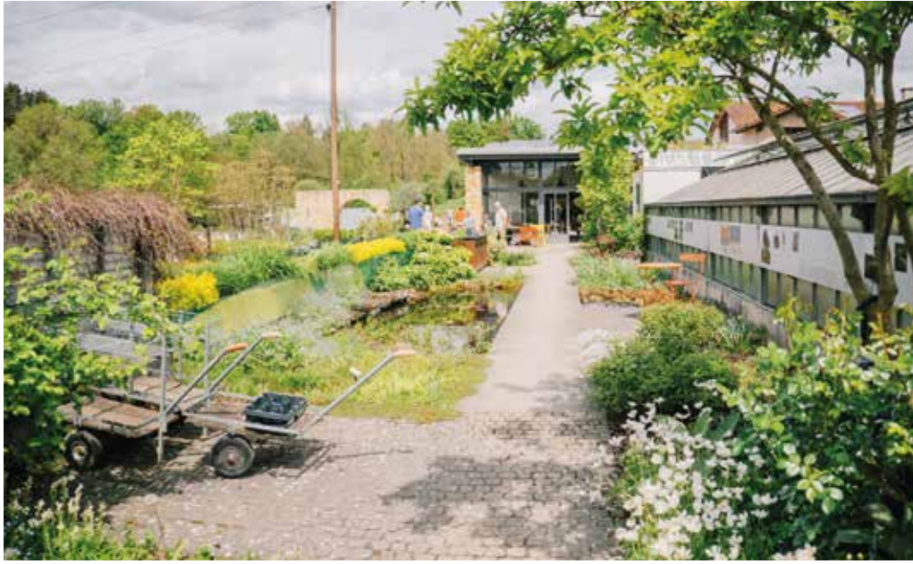
Auf dem Gärtnerhof gibt es eine große Auswahl an Pflanzen - und noch viel mehr.

Die richtige Planung, Pflanzenauswahl und die kompetente Umsetzung ist das offene Genussgeheimnis für einen Garten, in dem sich alle wohlfühlen und der später wenig Arbeit macht.