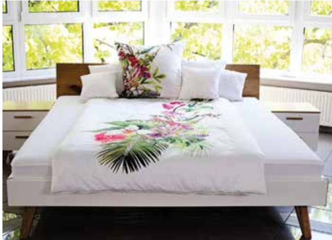
Für einen guten Schlaf im Sommer ist eine hochwertige Sommerbettdecke ausschlaggebend.

Schlafkomfort in heißen Nächten: Die besten Bettdecken für den Sommer von WAILAND