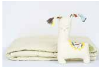
Alpakawolle ist hervorragend für den Sommer und Winter geeignet.