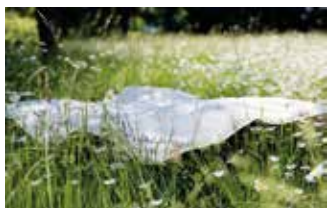
Luftig leichte Sommerbettdecke von WAILAND.

Eine der außergewöhnlichsten Sommerbetten ist die Lyocell-Bettdecke „Waldbaum“. Lyocell, eine natürliche Faser aus Holz, überzeugt durch ihre hervorragende Atmungsaktivität und