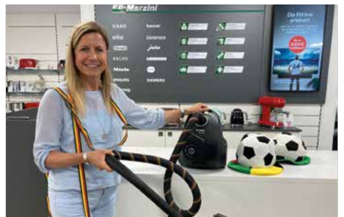
Attraktive Angebote gibts auch im Haushaltsgerätebereich.