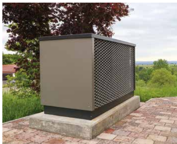
Das Außenmodul der Wärmepumpe ist sehr leise und, Rolf Unfried zufolge, akustisch kaum wahrnehmbar.

Auch Rolf Unfried aus Hohenstaufen wollte seine alte Gas-therme durch eine umweltfreundliche Wärmepumpe ersetzen, nachdem sein Gasanbieter angekündigt hatte, dass die Heizkosten in Zukunft drastisch steigen würden. „Aber auch so wollte ich weg von den fossilen Brennstoffen und den Strom, den ich mit meiner Photovoltaik-Anlage auf dem Dach selbst erzeuge, in Zukunft für den Betrieb ei-