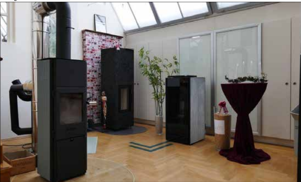
Sommermonate zur Modernisierung nutzen – Einbau eines neuen Kachelofen- oder Heizkamineinsatzes dauert nur ein bis zwei Tage.