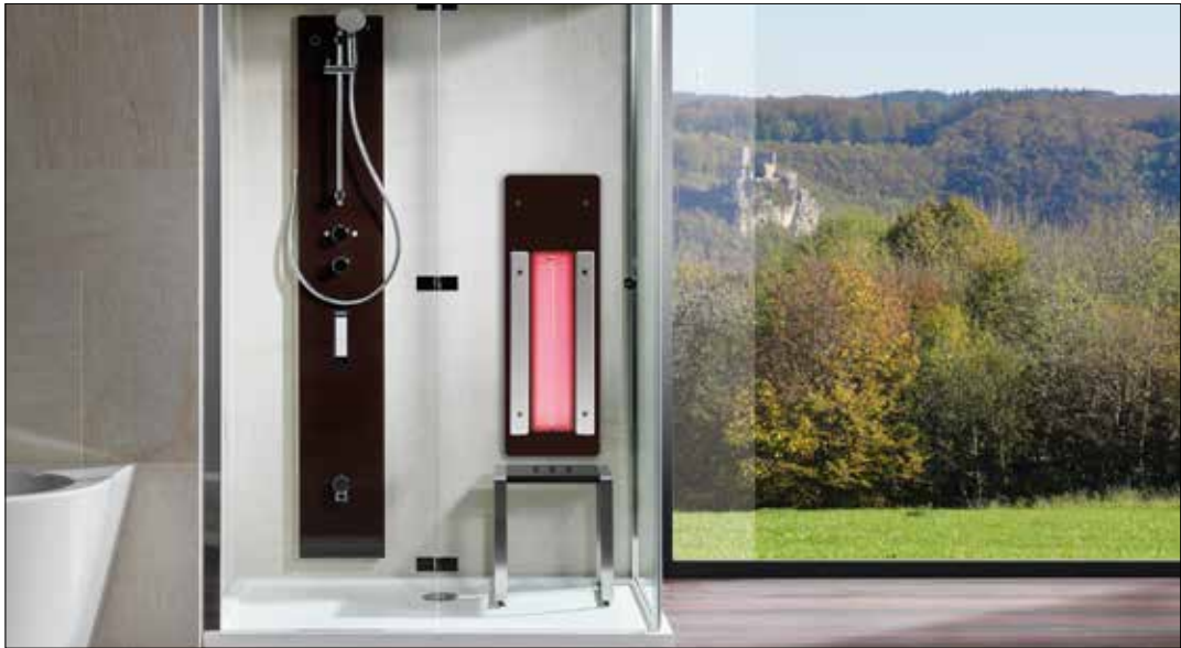
Bereits mit wenigen Handgriffen und kleinem Budget kann man aus seinem Badezimmer eine Wellnessoase machen. So auch zum Beispiel mit einem Infrarotpaneel gegen Verspannungen.