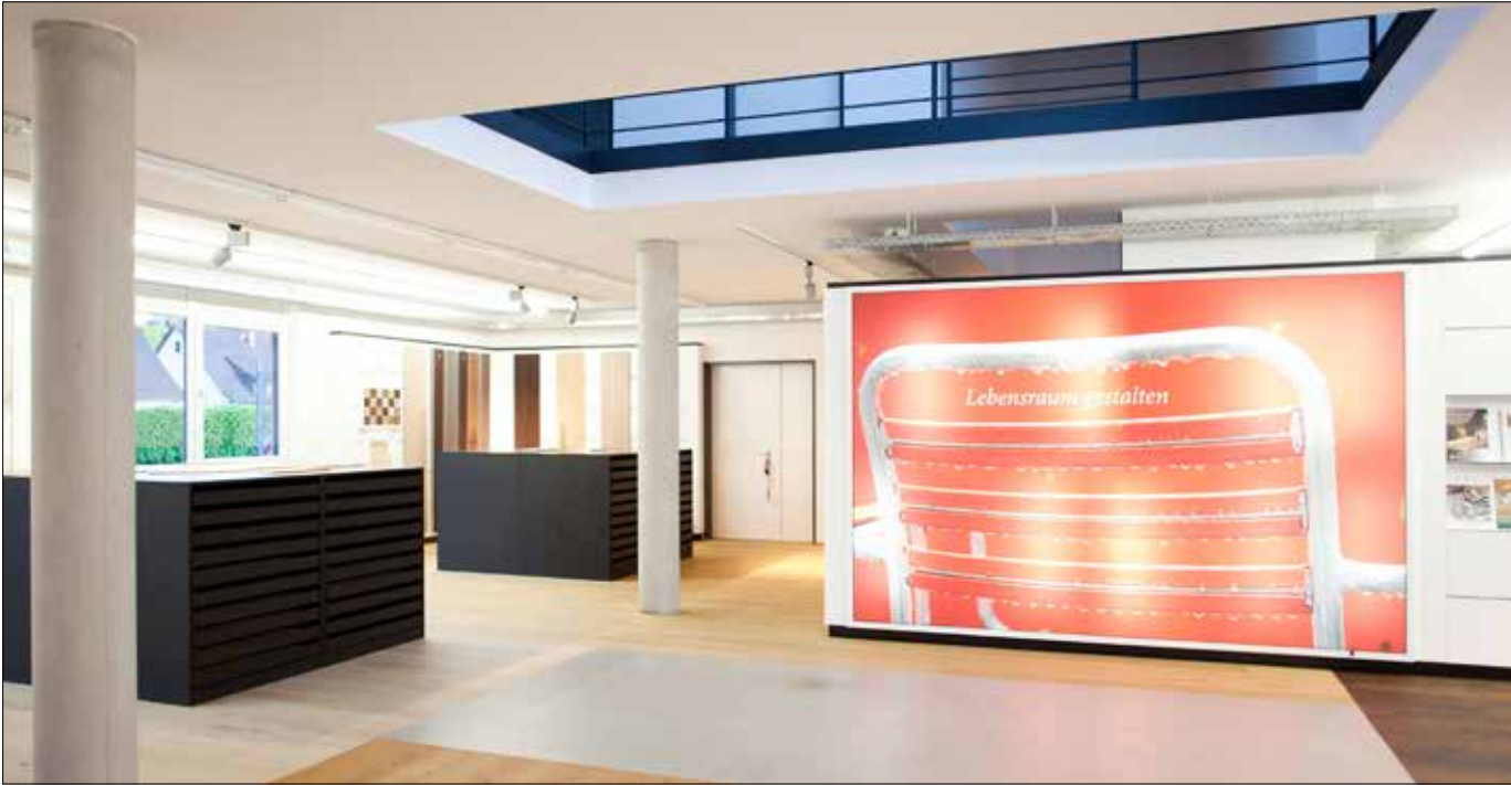
Klares Konzept, klarer Fokus: Parkett – großzügig dimensioniert und farblich gegeneinander abgesetzt.